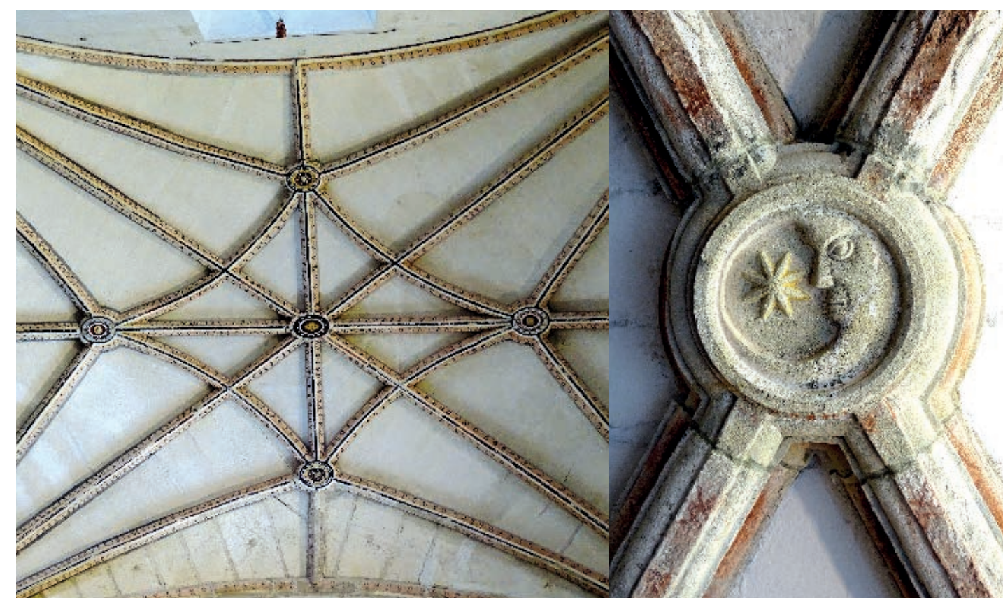
Cúpula nervada del presbiterio

Pilastras dobles de cuerpo cajeado y refundido conforman un entablamento de gusto toscano